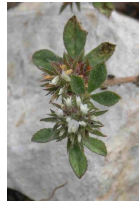
Trèfle scabre ( Trifolium scabrum )