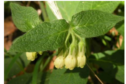
Consoude tubéreuse ( Symphytum tuberosum )