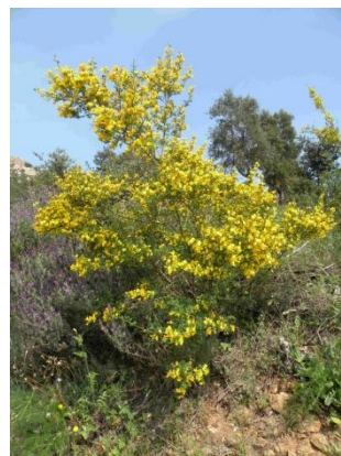
Calicotome épineux ( Cytisus spinosus , Calicotome spinosa )