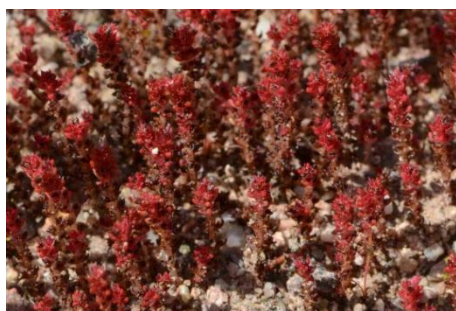
Crassule mousse ( Crassula tillaea )