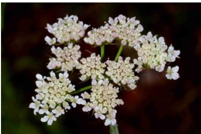
Oenanthe faux-boucage ( Oenanthe pimpinelloides )