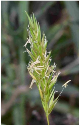
Flouve odorante ( Anthoxanthum odoratum )