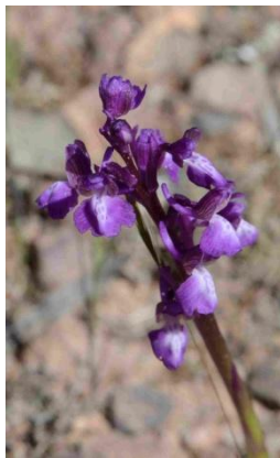
Orchis peint ( Anacamptis morio subsp. picta )