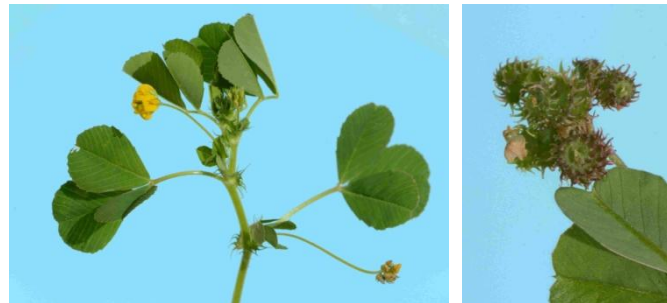
Luzerne polymorphe ( Medicago polymorpha )