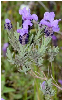
Lavande des Maures ( Lavandula stoechas )