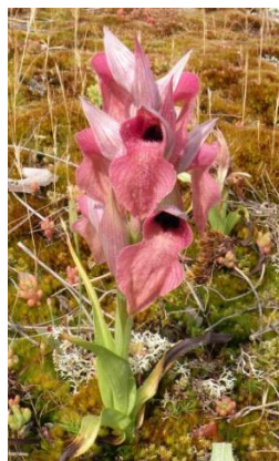
Sérapias négligé ( Serapias neglecta )