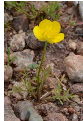
Renoncule des marais ( Ranunculus paludosus )