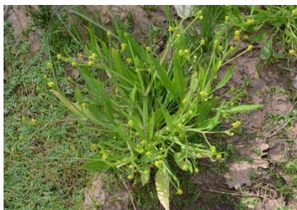
Renoncule de Revelière ( Ranunculus revelieri )