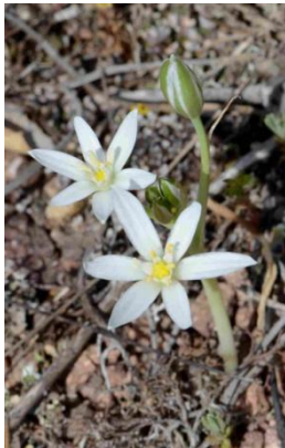
Ornithogale en ombelle ( Ornithogalum umbellatum )