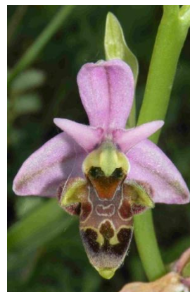
Ophrys bécasse ( Ophrys scolopax )