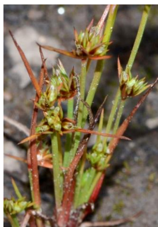
Jonc en têtes ( Juncus capitatus )