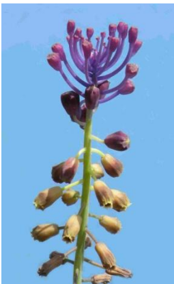
Muscari à toupet ( Muscari comosum )