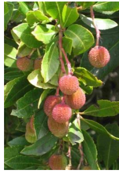
Arbousier ( Arbutus unedo )

Les fleurs blanches, en grelot, apparaissent en automne quand les fruits (qui sont comestibles) sont mûrs.