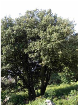
Chêne vert ( Quercus ilex )

Dans la Plaine des Maures, outre les espèces caractéristiques présentées ci-dessous, il faut signaler la présence d'autres arbrisseaux et sous-arbrisseaux moins abondants, que l'on retrouve aussi en milieu calcaire : Genévrier cade ( Juniperus oxycedrus ), Filaire à feuilles étroites ( Phillyrea angustifolia ), Amélanquier ( Amelanchier ovalis ), Lentisque ( Pistacia lentiscus ), Aubépine ( Crataegus monogyna ), Ciste cotonneux ( Cistus albidus ), Genêt poilu ( Genista pilosa ), Immortelle ( Helichrysum stoechas ) et Thym ( Thymus vulgaris ).