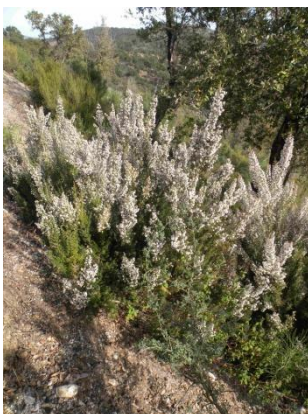
Bruyère arborescente ( Erica arborea )