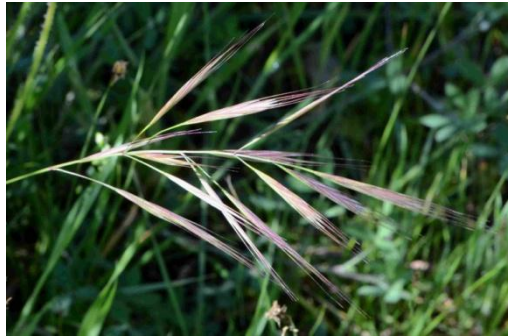
Brome à deux étamines ( Anisantha diandra )