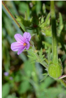
Erodium botrys ( Erodium botrys )