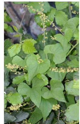
Tamier, Herbe aux femmes battues ( Discorea communis = Tamus communis )