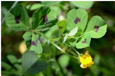
Luzerne d'Arabie ( Medicago arabica )