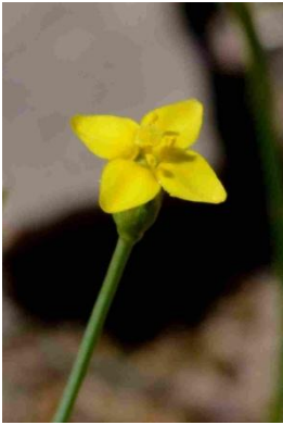
Cicendie filiforme ( Cicendia filiformis )