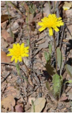
Liondent des rochers ( Leontodon saxatilis )