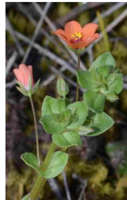
Mouron rouge ( Lysimachia arvensis )