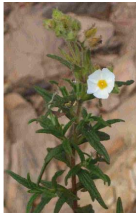
Ciste de Montpellier ( Cistus monspeliensis )