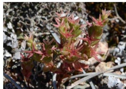
Orpin gazonnant ( Sedum caespitosum )