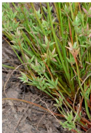
Jonc nain ( Juncus pygmaeus )