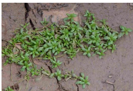
Callitriche pédonculée ( Callitriche brutia )