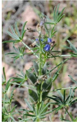
Lupin à feuilles étroites ( Lupinus angustifolius )