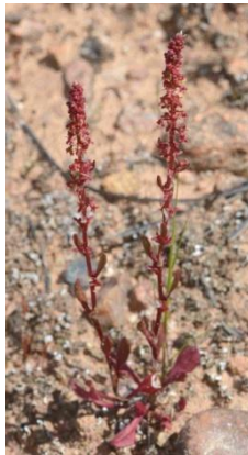
Oseille (Rumex) tête de bœuf ( Rumex bucephalophorus )