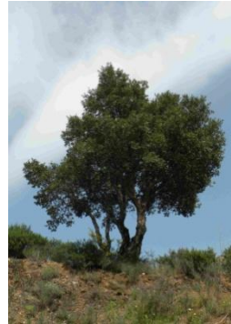
Chêne liège ( Quercus suber )