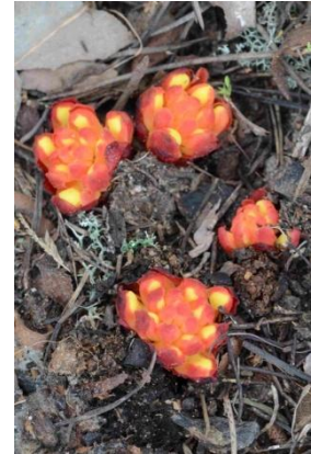
Cytinet jaune ( Cytinus hypocistis ) Sur Cistes à fleurs blanches