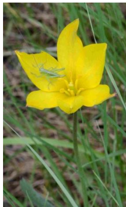
Tulipe méridionale (ou Tulipe australe) ( Tulipa sylvestris subsp. australis )