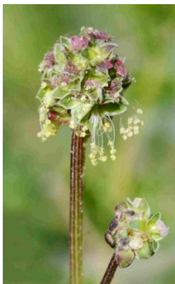
Petite pimprenelle ( Poterium sanguisorba = Sanguisorba minor )