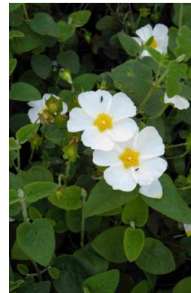
Ciste à feuilles de sauge ( Cistus salviifolius )