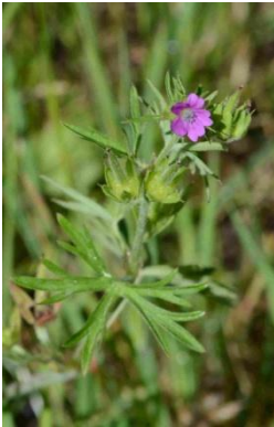
Géranium découpé ( Geranium dissectum )