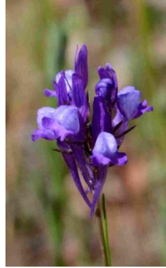
Linaire de Pellissier ( Linaria pellisseriana )