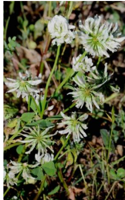
Trèfle noirissant ( Trifolium nigrescens )