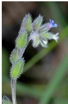
Mysotis bicolor ( Myosotis discolor )