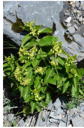
Dompte-venin ( Vincetoxicum hirundinaria )