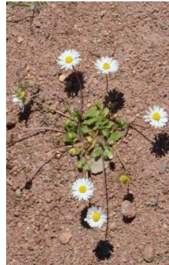
Pâquerette annuelle ( Bellis annua )