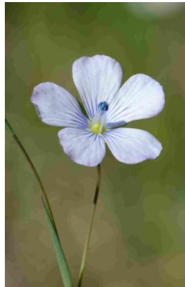
Lin bisannuel ( Linum usitatissimum subsp. angustifolium )