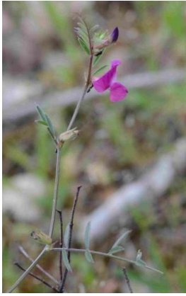
Vesce à feuilles étroites ( Vicia angustifolia )