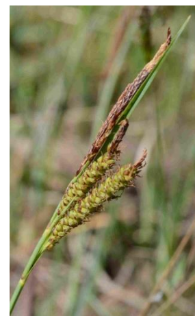
Laïche (ou Carex) glauque (ou lâche) ( Carex flacca = Carex glauca )