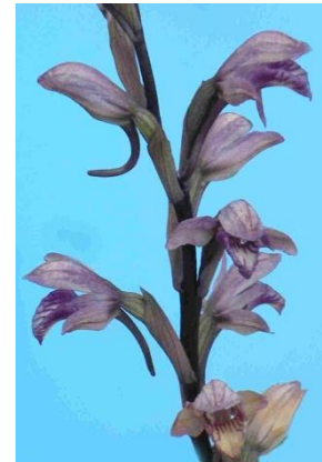
Limodore à feuilles avortées ( Limodorum abortivum )