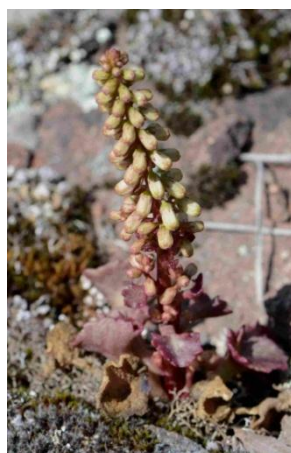
Ombilic des rochers, Nombriil de Vénus ( Umbilicus rupestris )