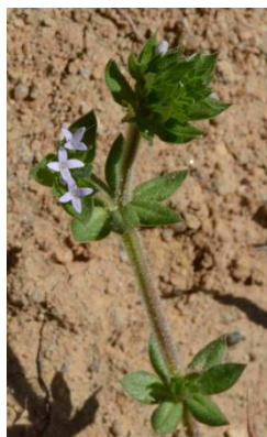
Shéardie des champs ( Sherardia arvensis )