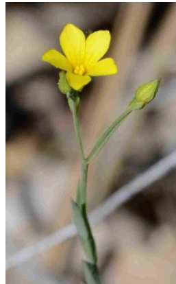
Lin à trois styles ( Linum trigynum )