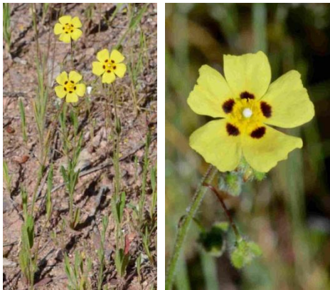
Hélianthème (Tubénaire) à gouttes ( Tuberaria guttata )