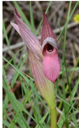
Sérapias langue ( Serapias lingua )