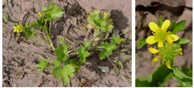
Renoncule à petites pointes ( Ranunculus muricatus )