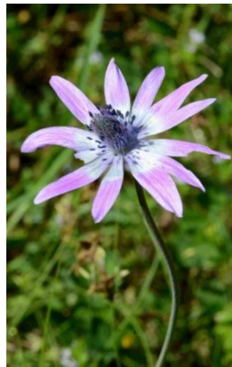
Anémone des jardins ( Anemone hortensis )