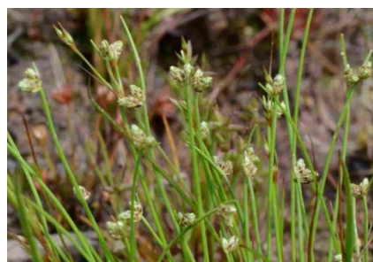
Isolépïs sétacé ( Isolépïs setacea )