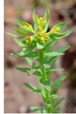
Euphorbe sillonnée ( Euphorbia sulcata )