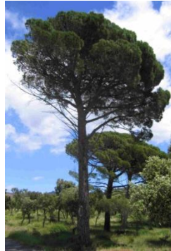
Pin parasol, Pin pignon ( Pinus pinea )