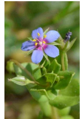
Mouron bleu ( Lysimachia foemina )