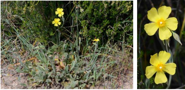
Tubénaire ( Diatelia tuberaria = Tuberaria lignosa )