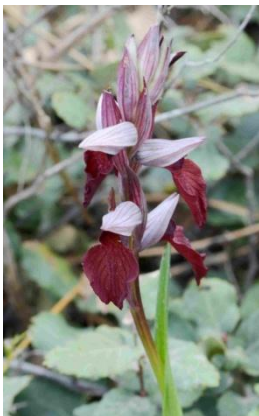
Sérapias en cœur ( Serapias cordigera )

Les nombreuses orchidées sont sans doute les espèces les plus recherchées dans la Plaine des Maures.