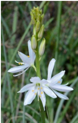
Phalangère fleur de lis ( Anthericum liliago )

(Les photos ne sont pas représentatives de la taille.)