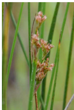
Jonc arqué ( Juncus inflexus )