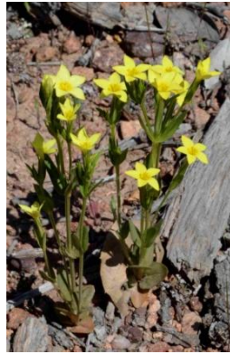
Petite centaurée maritime ( Centaurium maritimum )