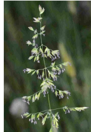
Pâturin des prés ( Poa pratensis )

Il y a de nombreuses Poacées (= Graminées) dans la Plaine des Maures, comme par exemple d'autres Bromes , l' Avoine , des Vulpies , des Dactyles , des Brizes , des Canches et des Pâturins ..