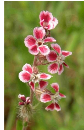
Silène de France ( Silene gallica )