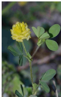
Trèfle des champs ( Trifolium campestre )