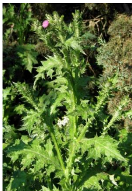
Chardon à capitules denses ( Carduus pycnocephalus )