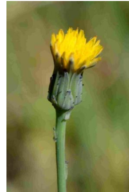
Porcelle glabre ( Hypochaeris glabra )