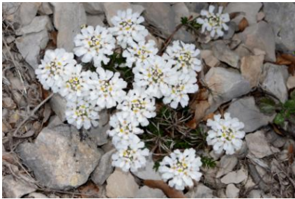
Ibérus des rochers ( Iberis saxatilis )