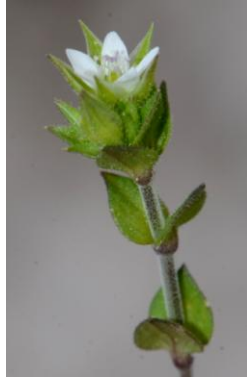
Sabline à feuilles de serpolet ( Arenaria serpyllifolia subsp. leptocladus )