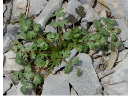
Aethionème des rochers ( Aethionema saxatilis )