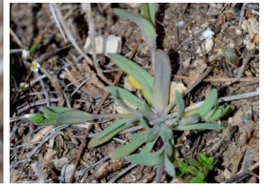
Holostée en ombelle ( Holosteum umbellatum )