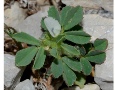
Trigonelle en glaive ( Trigonella gladiata )