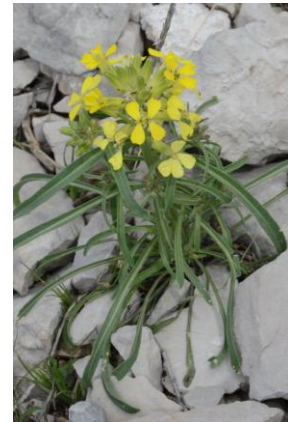
Vélar de Provence ( Erysimum nevadense subsp. collisparsum )