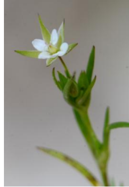
Minuartie hybride ( Minuartia hybrida subsp. ?)