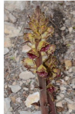
Orobanche grêle ( Orobanche gracilis )