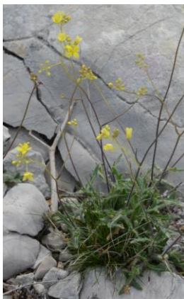
Lunetière valentine ( Biscutella valentina )