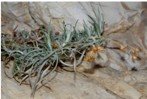
Phagnalon repoussant ( Phagnalon sordidum )