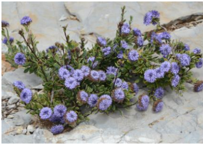
Globulaire Alypon ( Globularia alypum )