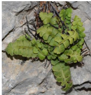
Asplénium de Pétrarque ( Asplenium petrarcae ) Minuscule fougère (< 10 cm), assez rare, poussant dans les anfractuosités des rochers.