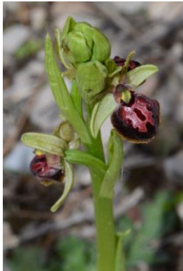
Ophrys de la Passion ( Ophrys passionis )