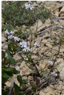
Ibérus à feuilles de lin ( Iberis linifolia subsp. linifolia )