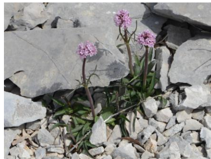
Valériane tubéreuse ( Valeriana tuberosa )