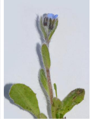
Myosotis hérissé ( Myosotis ramosissima ) Calice à poils étalés (presque perpendiculaires)