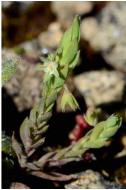
Astéroline en étoile ( Lysimachia linum-stellatum )