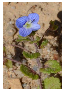
Véronique de Perse ( Veronica persica )