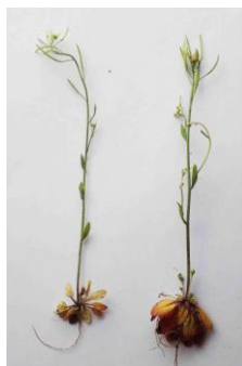
Arabidopsis de Thal ( Arabidopsis thaliana )