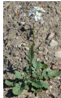
Fausse roquette ( Diplotaxis eruroides )