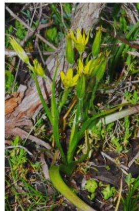
Gagée de Lacaitae ( Gagea lacaitae )