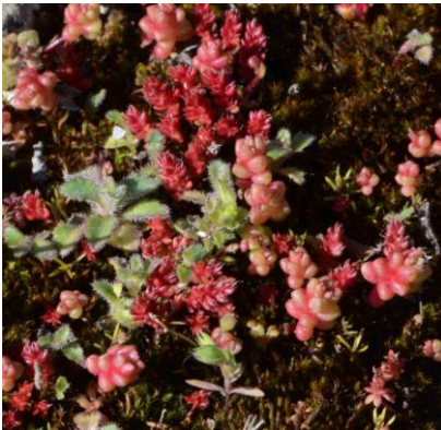
L'association Crassula tillaea - Sedum caespitosum