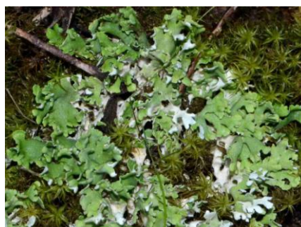
Cladonia foliacea subsp. endiviifolia