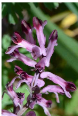
Fumeterre de Gaillardoti ( Fumaria gaillardotii ) Rare