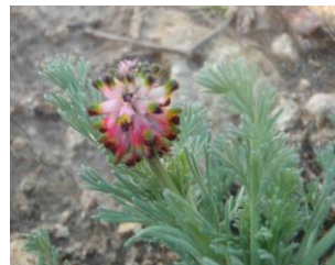
Fumeterre en épi ( Platycapnos spicata )