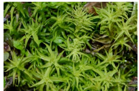
Mousse étoilée ( Tortella squarrosa = Pleurochaete squarrosa )