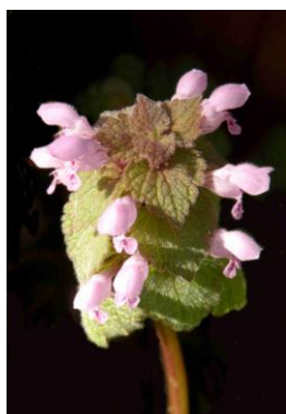
Lamier pourpre ( Lamium purpureum )