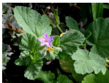
Erodium fausse-mauve ( Erodium malacoides )