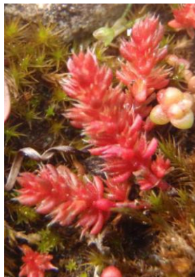
Crassule mousse ( Crassula tillaea )