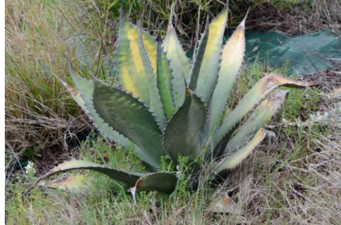
Agave féroce ( Agave salmiana = Agave ferox )