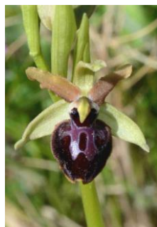
Ophrys de la Passion ( Ophrys passionis )