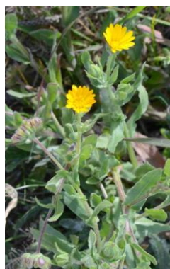
Souci des champs ( Calendula arvensis )