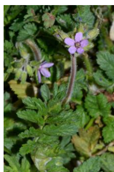
Erodium musqué ( Erodium moschatum )