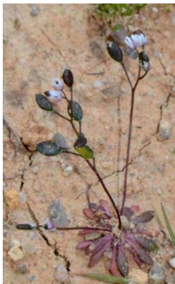
Drave printanière ( Draba verna )