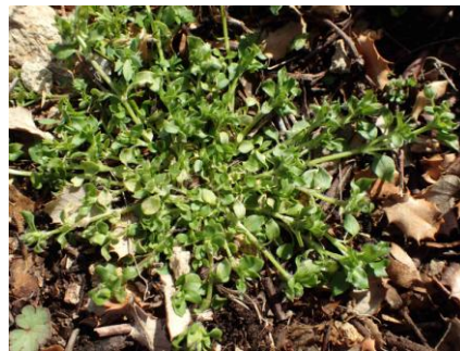
Stellaire intermédiaire, Mouron des oiseaux ( Stellaria media )