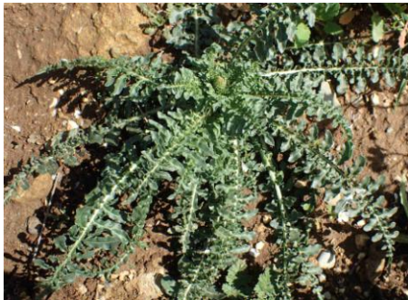
Réséda blanc ( Reseda alba )