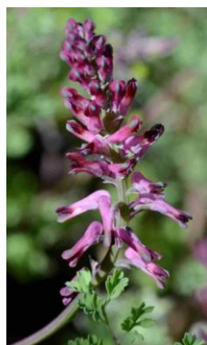
Fumeterre officinale ( Fumaria officinalis )