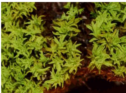
Barbula convoluta (= Streblotrichum convolutum )