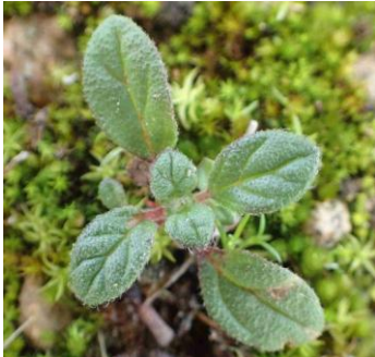
Hélianthème à feuilles de saule ( Helianthemum salicifolium )