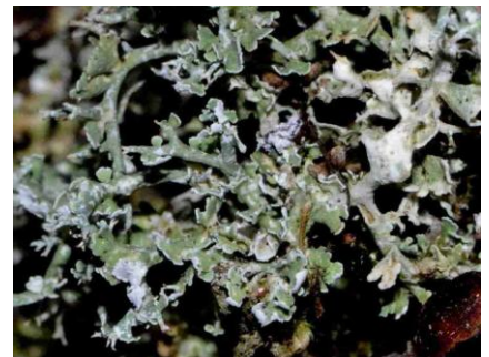
Cladonia furcata subsp. furcata morpho pinnata