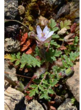
Erodium bec-de-grue ( Erodium cicutarium )