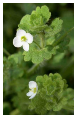
Véronique cymbalaire ( Veonica cymbalaria )