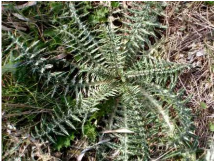
Chardon laiteux, Chardon élégant ( Galactites tomentosus = Galactites elegans )