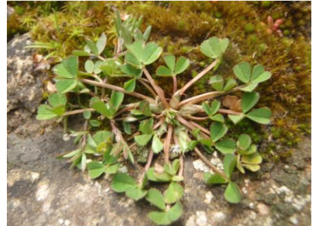
Trèfle étranglé ( Trifolium suffocatum )