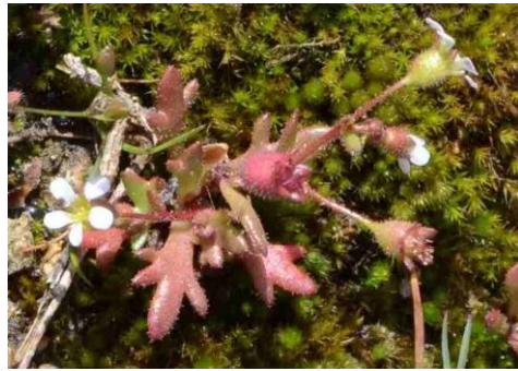
Saxifrage tridactyle ( Saxifraga tridactylites )