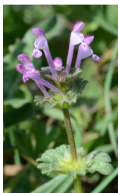
Lamier pied-de-poule ( Lamium amplexicaule )