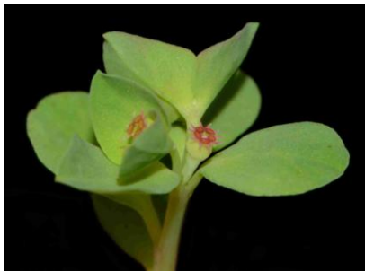
Euphorbe des jardiniers var. peplodes ( Euphorbia peplus var. peplodes )