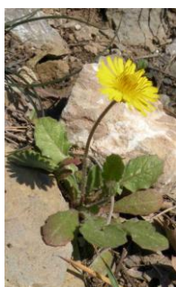
Crépide de Nîmes ( Crepis sancta )