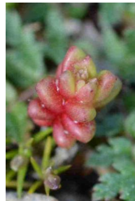
Orpin gazonnant ( Sedum caespitosum ) Plus ou moins rougissant suivant le substrat