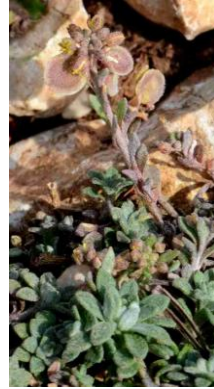
Clypéole ( Clypeola jonthlaspi )