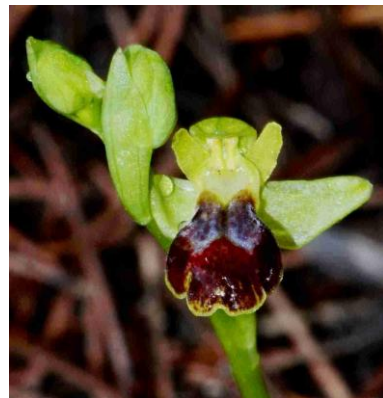
Ophrys de Forestier ( Ophrys delforgei = Ophrys forestieri )