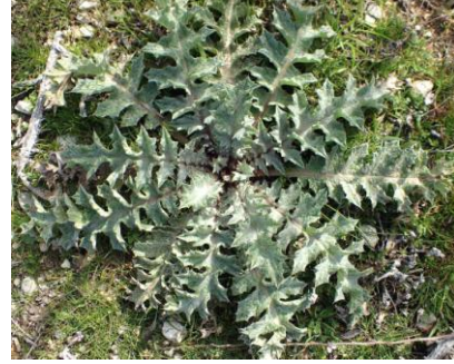
Onopordon d'Illyrie ( Onoordum illyricum )