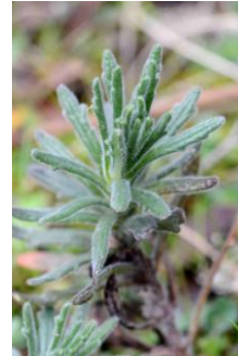
Bugle ivette ( Ajuga iva )