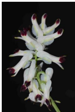
Fumeterre grimpante ( Fumaria capreolata )