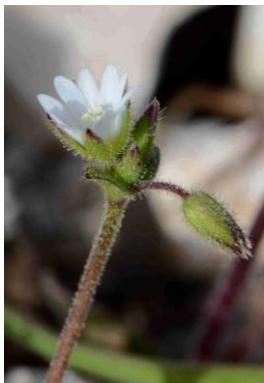
Céraiste nain ( Cerastium pumilum )