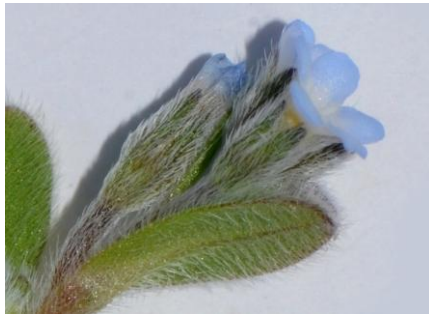
Myosotis nain ( Myosotis pusilla ) Calice à poils appliqués, tous dirigés vers le sommet. Rare