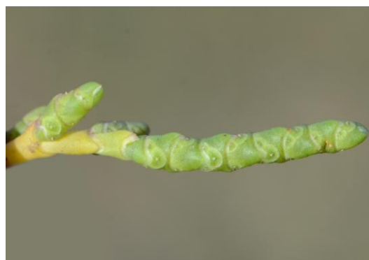
Salicorne (Salicornia patula ?)