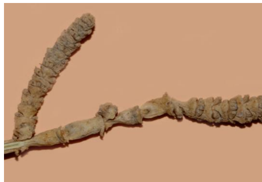
Rameau séché de Salicorne glauque ( Arthrocnemum macrostachyum )