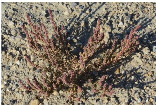
Soude maritime ( Suaeda maritima )

Dans cette partie de sansouïre, bien asséchée, on observe la Soude maritime et une Salicorne très ramifiée qui, après examen nous semble être Salicornia ramosissima , avec les réserves qui s'imposent pour ce genre ! On trouve aussi des plants complètement secs de la grande espèce Arthrocnemum macrostachyum (Salicorne glauque).