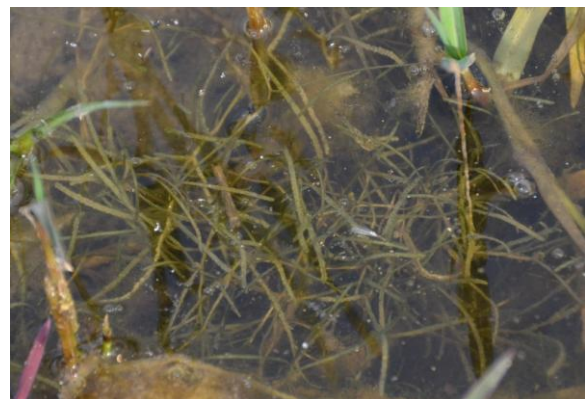
Zannichellie des marais ( Zannichella palustris )