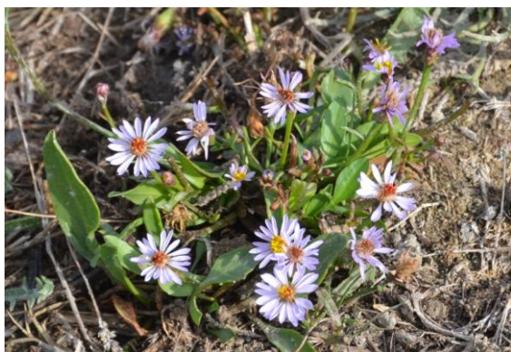
Aster maritime (Tripolium pannonicum)

Sur la terre ferme, à proximité, on observe quelques rares plantes encore fleuries au mois d'octobre, dont deux espèces exclusivement littorales :