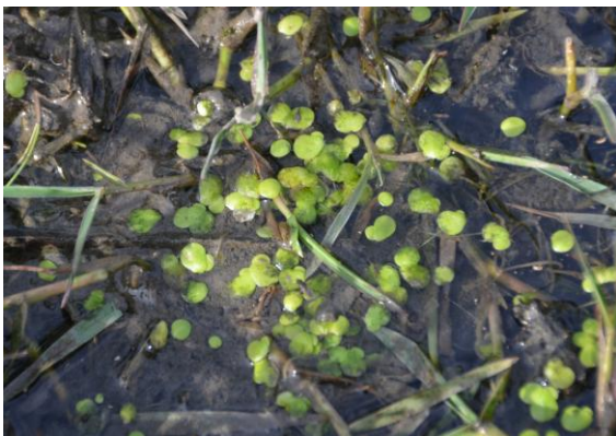
Lentilles d'eau ( Lemna minor )

Notre intérêt se porte rapidement sur deux plantes aquatiques : les Lentilles d'eau flottant à la surface ( Lemna minor , aujourd'hui classée dans la famille des Araceae) et la rare Zannichellie des marais ( Zannichella palustris , famille des Potamogetonaceae), avec ses fines lanières flottant entre les souches des diverses Poacées.