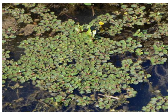
Jussie faux peplus ( Ludwigia peploides )