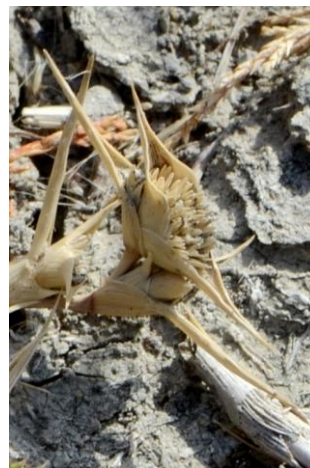
Crypsis piquant (Crypsis aculeata)

On trouve aussi quelques Salicornes, ce genre étant un véritable casse-tête pour les botanistes ! Après un examen approfondi, à tête reposée après la sortie, on penchera pour Salicornia patula , proche de Salicornia europaea , mais sans véritable certitude.