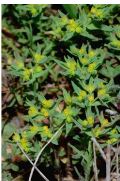
Euphorbe exiguë ( Euphorbia exigua )