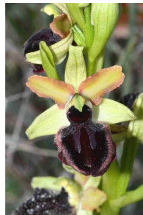
Ophrys de la Passion ( Ophrys passionis )