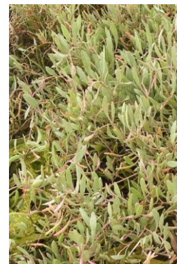
Obione ( Halimione portulacoides )