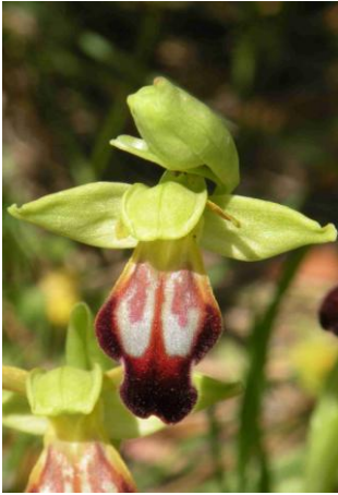
Ophrys des Lupercales ( Ophrys lupercalis Groupe de Ophrys fusca )