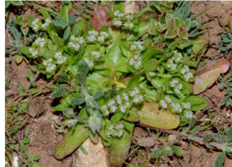
Doucette à petits fruits ( Valerianella microcarpa )