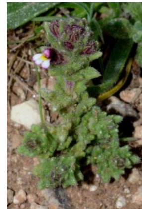
Euphragie à larges feuilles ( Parentucellia latifolia )