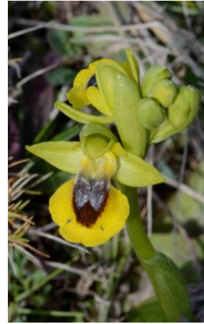
Ophrys jaune ( Ophrys lutea )