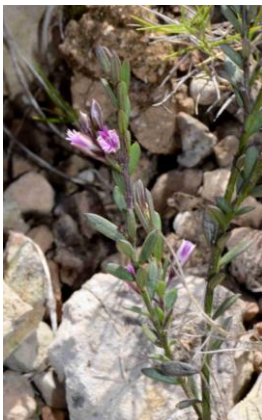
Polygale (ou Polygala) des rochers ( Polygala rupestris )