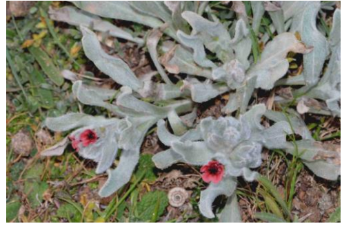
Cynoglosse à feuilles de giroflée ( Pardoglossum cheirifolium )