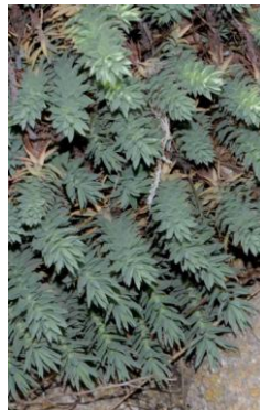
Euphorbe des Baléares ( Euphorbia pithyusa )