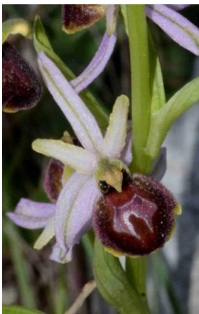
Ophrys élevé ( Ophrys exaltata = Ophrys arachnitiformis auct.)