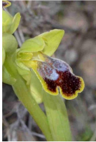
Ophrys de Forestier ( Ophrys delforgei = O. forestieri , Groupe de Ophrys marmorata )