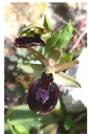
Ophrys hybride ( Ophrys passionis x bertolonii )