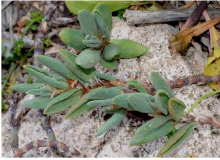
Renouée maritime ( Polygonum maritimum )