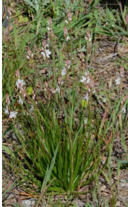
Asphodèle fistuleux ( Asphodelus fistulosus )