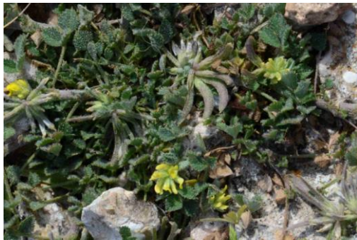
Trigonelle de Montpellier ( Medicago monspeliaca )