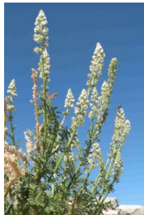
Réséda blanc ( Reseda alba )