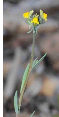
Linaire simple ( Linaria simplex )