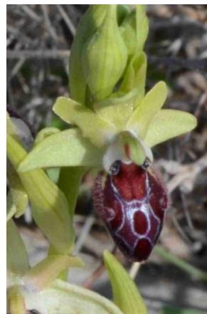
Ophrys de Provence ( Ophrys provincialis )