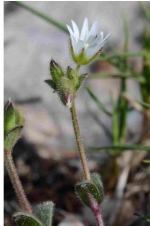
Céraiste nain ( Cerastium pumilum )