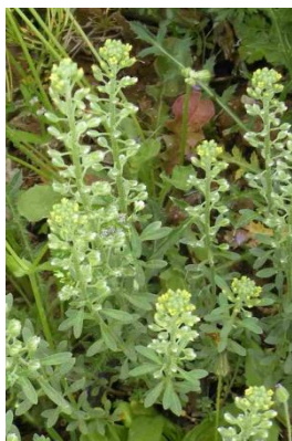
Passerage à calice persistant ( Alyssum alyssoides )