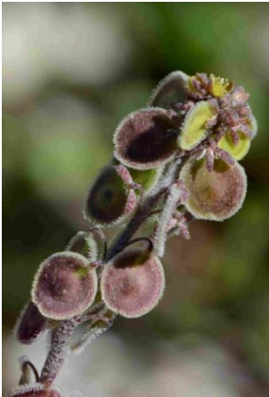
Clypéole ( Clypeola jonthlaspi )