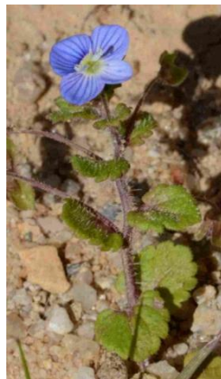
Véronique de Perse ( Veronica persica )