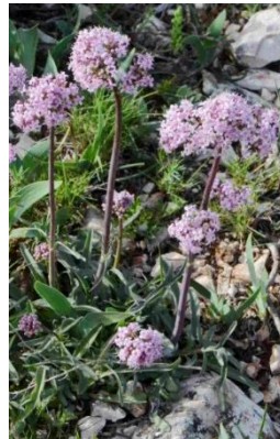
Valériane tubéreuse ( Valeriana tuberosa )