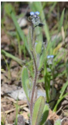
Myosotis très rameux, Myosotis hérissé ( Myosotis ramosissima )