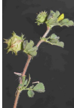
Luzerne raide ( Medicago rigidula )