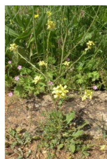
Rapistre rugueux ( Rapistrum rugosum )