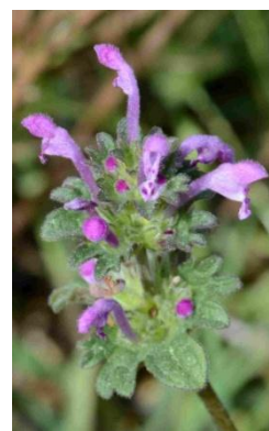
Lamier pied-de-poule ( Lamium amplexicaule )