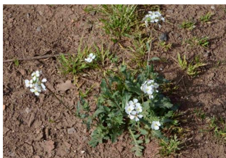
Fausse roquette ( Diplotaxis eruroides )