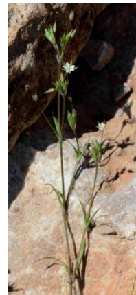
Minuartie grêle ( Minuartia hybrida subsp. laxa )