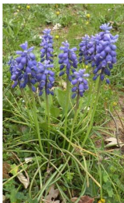
Muscari négligé ( Muscari neglectum )