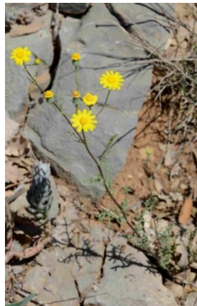
Sénéçon de France ( Senecio gallicus )