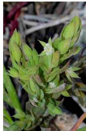
Astéroline en étoile ( Lysimachia linum-stellatum )