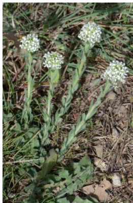
Passerage hérissée ( Lepidium hirtum )