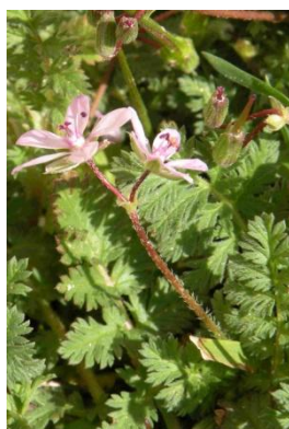
Erodium à feuilles de ciguë ( Erodium cicutarium )