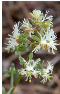
Réséda raiponce ( Reseda phyteuma )