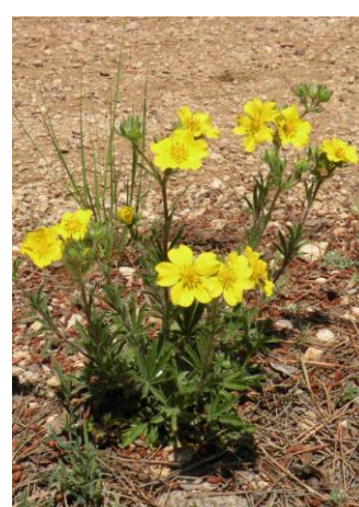
Potentille hérissée ( Potentilla hirta )