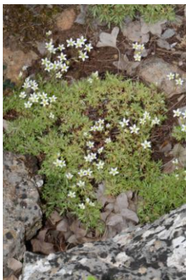
Saxifrage continentale ( Saxifraga fragosoi )