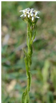
Arabette hérissée ( Arabis hirsuta )