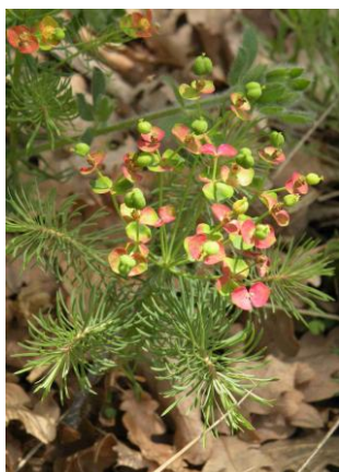
Euphorbe petit cyprès ( Euphorbia cyparissias )