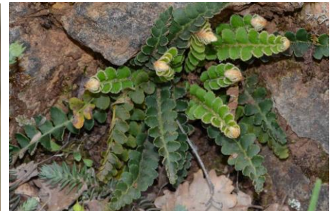
Cétérach officinal ( Asplenium ceterach )