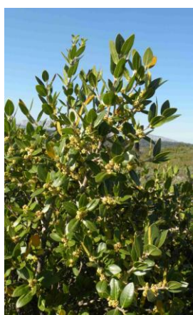
Filaire à larges feuilles ( Phillyrea latifolia )