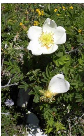
Rosier pimprenelle ( Rosa spinosissima , Rosa pimpinellifolia )