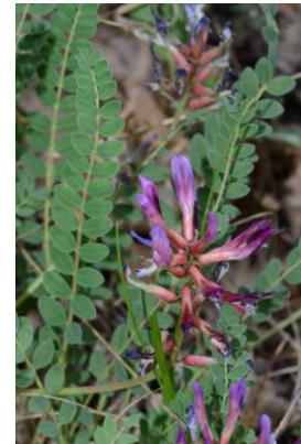
Astragale de Montpellier ( Astragalus monspessulanus )