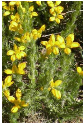
Genêt d'Espagne ( Genista hispanica )