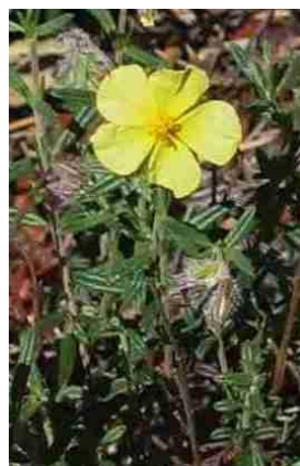
Hélianthème hérissé ( Helianthemum hirtum )