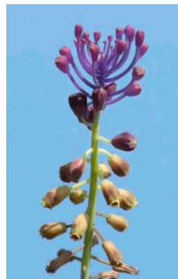
Muscari à toupet ( Muscari comosum )