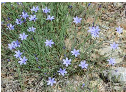
Aphyllante de Montpellier ( Aphyllantes monspeliensis )