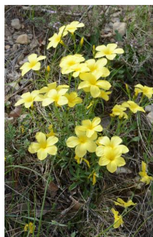
Lin campanulé ( Linum campanulatum )