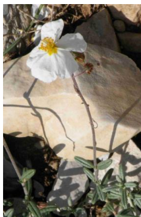
Hélianthème des Apennins ( Helianthemum apenninum )