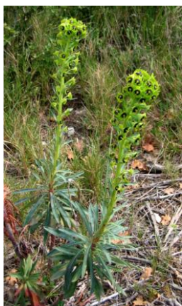
Euphorbe characias ( Euphorbia characias )