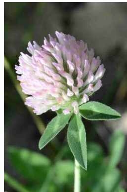
Trèfle des prés ( Trifolium pratense )