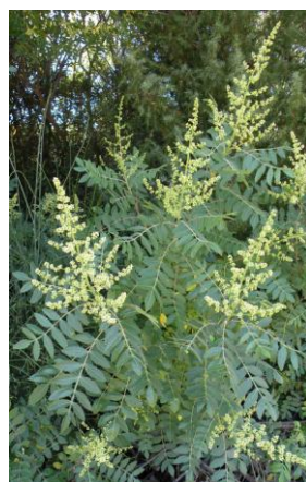
Sumac des corroyeurs ( Rhus coraria )