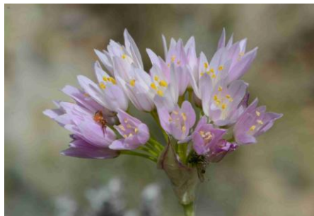
Ail rose ( Allium roseum )