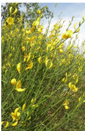
Spartier ( Spartium junceum )