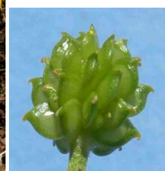
Renoncule bulbeuse ( Ranunculus bulbosus )