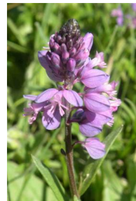
Polygale à toupet ( Polygala comosa )