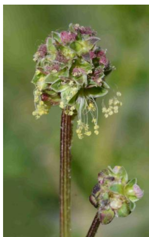
Pimprenelle, Petite sanguisorbe ( Poterium sanguisorba , Sanguisorba minor )