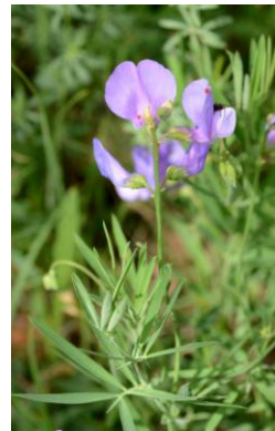
Gesse filiforme ( Lathyrus filiformis )