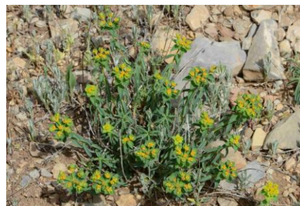
Euphorbe à tête jaune ( Euphorbia flavicoma )