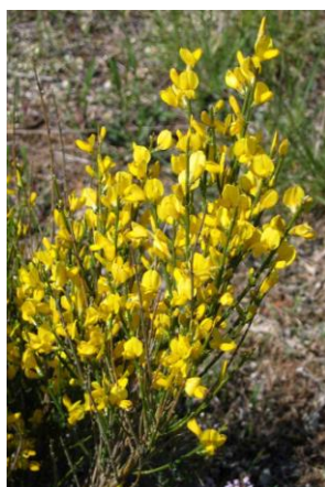
Genêt cendré ( Genista cinerea )