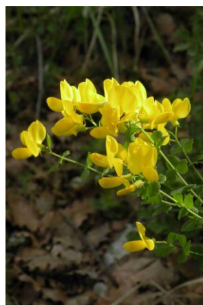
Cytise à feuilles sessiles ( Cytisophyllum sessilifolium )