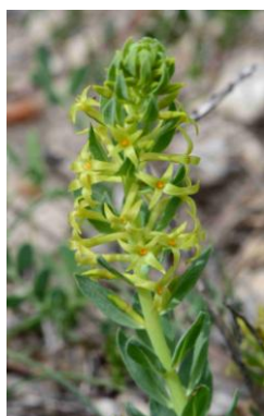
Thyméléée sanamunda ( Thymelaea sanamunda )