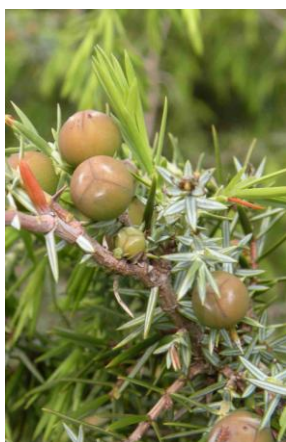
Genévrier cade ( Juniperus oxycedrus )