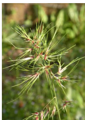
Pâturin bulbeux ( Poa bulbosa )