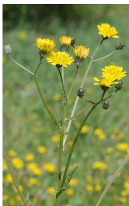
Crépis à feuilles de pissenlit ( Crepis vesicaria subsp. taraxifolia )