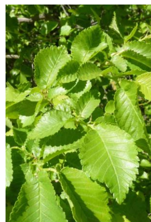
Ormeau ( Ulmus minor )

Ne figurent pas ici des espèces présentes mais très communes : Chêne vert ( Quercus ilex ), Chêne pubescent ( Quercus pubescens ), Chêne kermès ( Quercus coccifera ) et Pin d'Alep ( Pinus halepensis ).