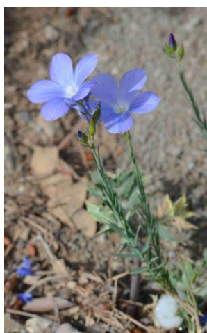
Lin de Narbonne ( Linum narbonense )