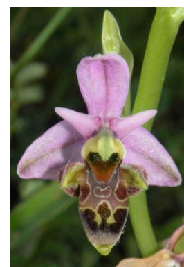
Ophrys bécasse ( Ophrys scolopax )