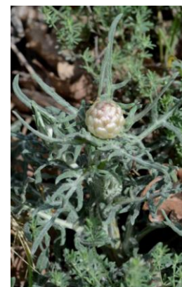
Leuzée conifère ( Leuzea conifera )