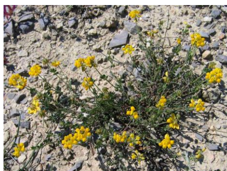
Petite Coronille ( Coronilla minima )