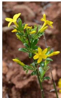
Jasmin buissonnant ( Jasminum fruticans )