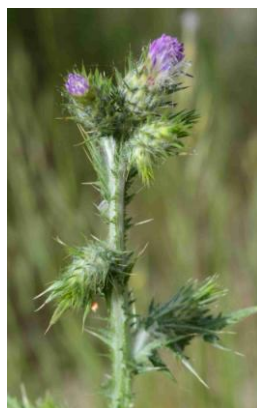
Chardon à capitules denses ( Carduus pycnocephalus )