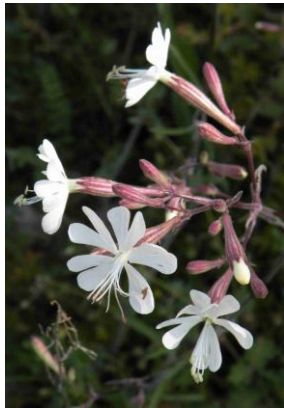
Silène d'Italie ( Silene italica )