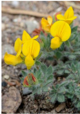
Lotier de Delort ( Lotus delortii )