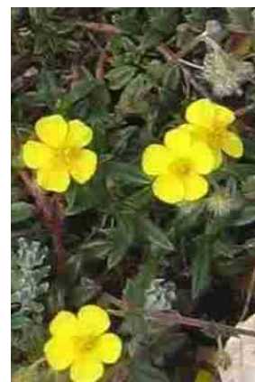
Hélianthème d'Italie ( Helianthemum aelandicum subsp. italicum )