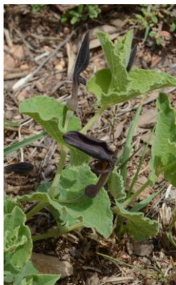
Aristolochie pistoloche ( Aristolochia pistolochia )