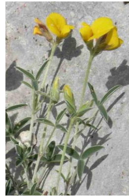
Argyrolobe de Zanon ( Argyrolobium zanonii )