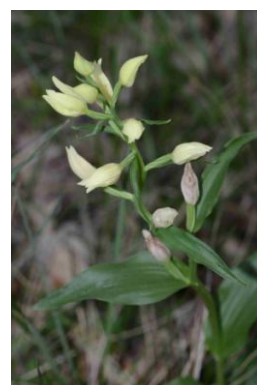
Céphalanthère de Damas ( Cephalanthera damasonium )