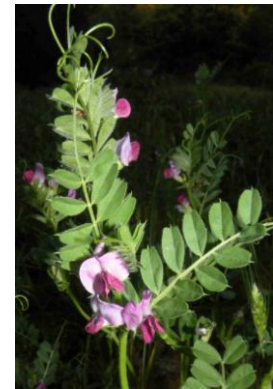
Vesce cultivée ( Vicia sativa )