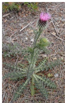
Chardon de la Sainte-Baume ( Carduus litigiosus )