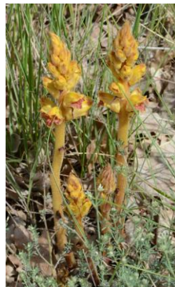
Orobanche grêle ( Orobanche gracilis )