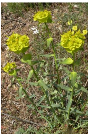
Euphorbe dentée ( Euphorbia serrata )