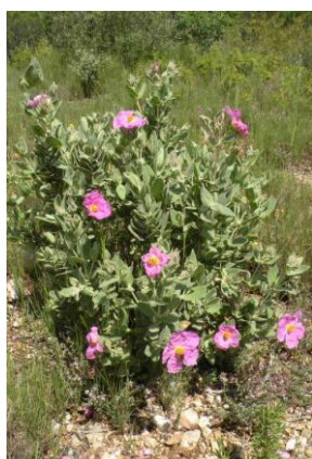
Ciste cotonneux ( Cistus albidus )