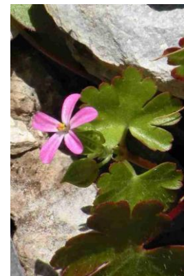
Géranium luisant ( Geranium lucidum )