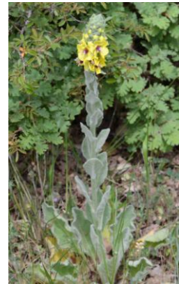
Molène de mai ( Verbascum boerhavii )