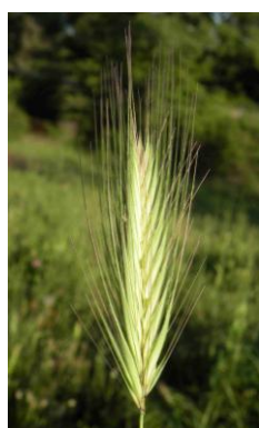
Orge des rats ( Hordeum murinum )