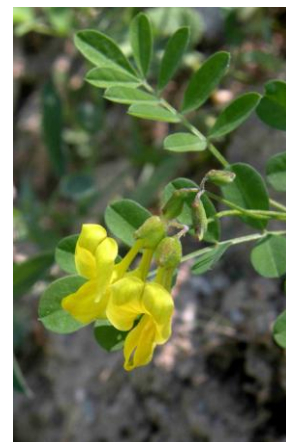
Coronille arbrisseau ( Hippocrepis emerus )