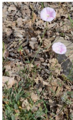
Liseron cantabrique ( Convolvulus cantabrica )