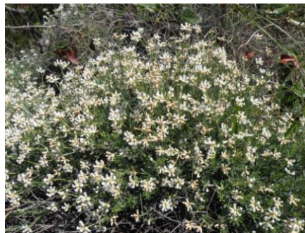
Badasse ( Lotus dorycnium , Dorycnium pentaphyllum )