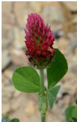
Trèfle incarnat ( Trifolium incarnatum )