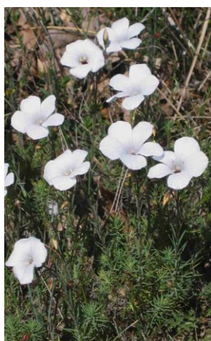
Lin blanc ( Linum suffruticosum subsp. appressum )