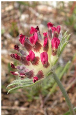
Anthyllide rouge ( Anthyllis vulneraria subsp. praepropera )