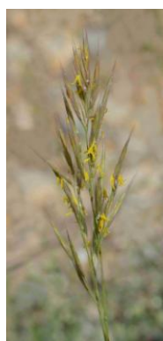
Brome dressé ( Bromopsis erecta , Bromus erectus )