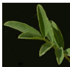
Hippocrévide fer à cheval ( Hippocrepis comosa )