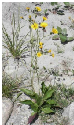
Epervière des murs ( Hieracium gr. murorum )