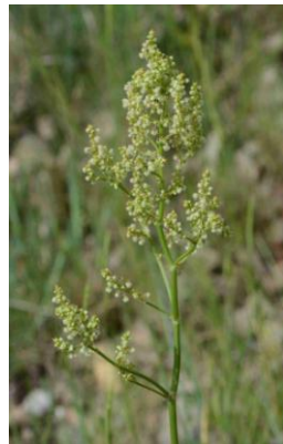
Rumex intermédiaire ( Rumex media )