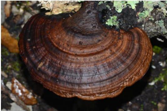
Scenidium nitidum ( Daedaleopsis nitida ) (Polypore nid d'abeilles, Tramète brillant)