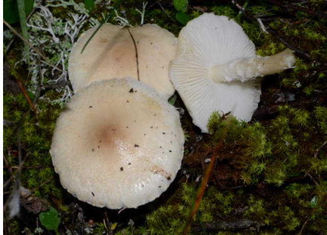
Lepiota ochraceosulfurescens (Lépiote jaunissante)