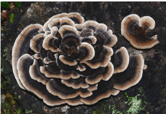
Trametes versicolor (Tramète versicolore, Tramète de couleur variable)