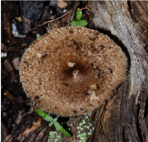
Cerioporus meridionalis ( Polyporus meridionalis ) (Polypore méridional)