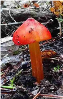
Hygrocybe conica (Hygrophore conique)