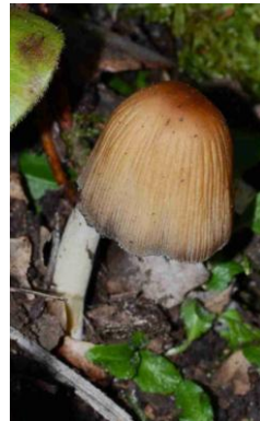
Coprinellus saccharinus (Coprin saupoudré)