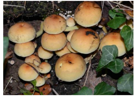
Hypholoma fasciculare (Hypholome en touffes)