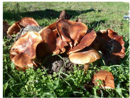
Armillaria mellea (Armillaire couleur de miel)