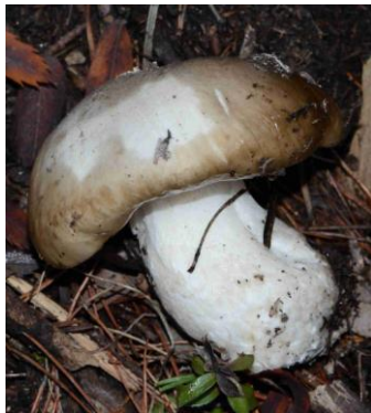
Hygrophorus latitabundus = Hygrophorus limacinus (Hygrophore limace)