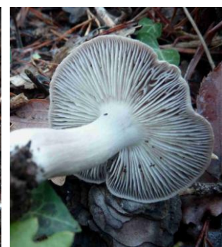
Tricholoma terreum (Tricholome terreux, Grisets, Petit-gris)