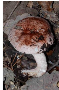
Hygrophorus russula (Hygrophore russule, Vinassier)