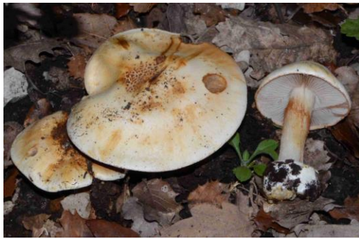
Cortinarius calochrous (Cortinaire à belles couleurs)