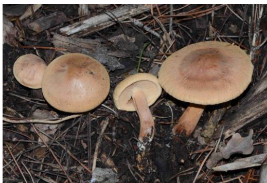
Tricholoma psammopus (Tricholome sablé)