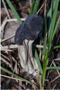
Helvella lacunosa (Helvelle lacuneuse)