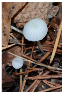
Hemimycena lactea (Mycène blanc de lait)