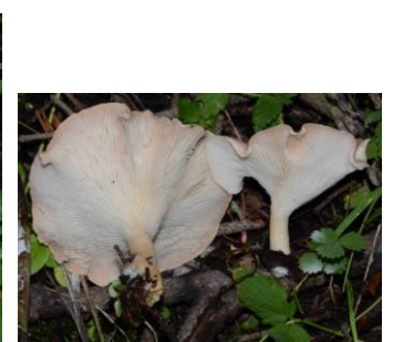
Clitocybe gibba (Clitocybe en entonnoir)