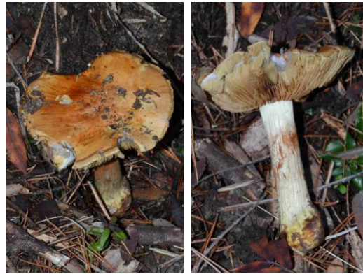
Cortinarius elegantissimus (Cortinaire très élégant)