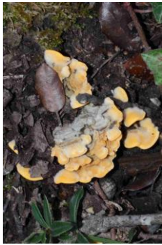
Stereum hirsutum (Stérée hirsute)