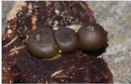
Hypoxyylon fragiforme (Hypoxyylon en forme de fraise)