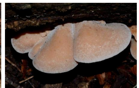
Panellus mitis (Pannelle douce)