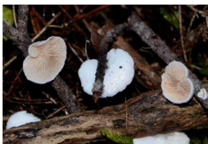
Crepidotus cesatii var. subsphaerosporus (Crépidote à spores sphériques)