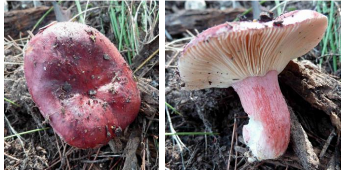
Russula torulosa (Russule des pinèdes)