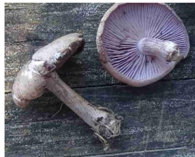
Lepista nuda = Tricholoma nuda (Pied bleu)