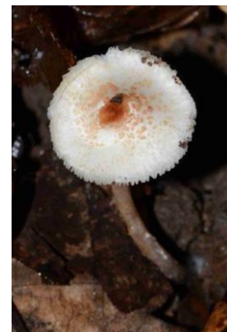
Lepiota cristata (Lépiote à crête)