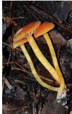
Hygrocybe reae (Hygrophore de Rea)