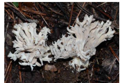
Clavulina cristata (Clavaire à crêtes)