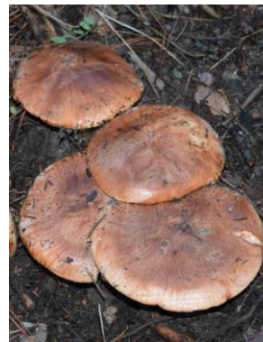
Tricholoma fractitum = Tricholoma batschii (Tricholome à pied bicolore)