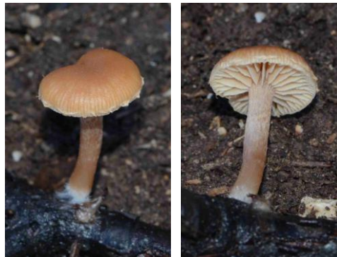
Tubaria conspersa (Tubaire voilée)