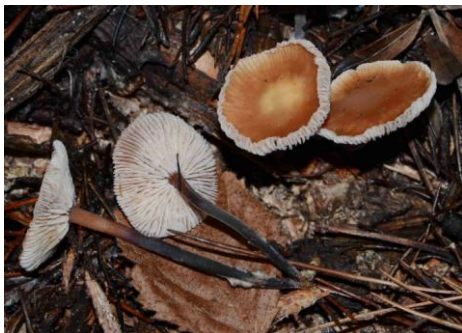
Gymnopus brassicolens = Micromphale br. (Marasme à odeur de chou)