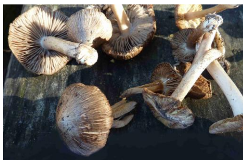
Inocybe fastigiata (Inocybe fastigié)