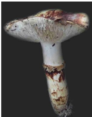
Tricholoma caligatum (Tricholome chaussé)