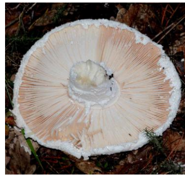
Amanita ovoidea (Amanite ovoïde)