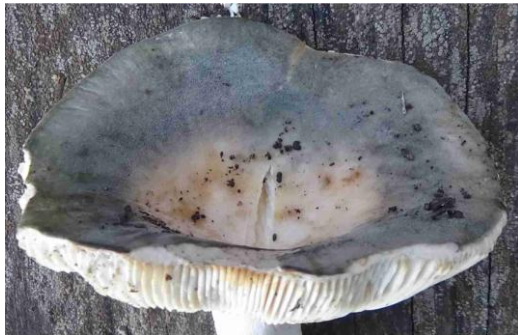
Russula pseudoaeruginea fo. galochroa (Russule pseudo-vert-de-gris)