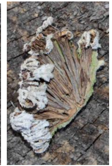
Schizophyllum commune (Schizophylle commun)