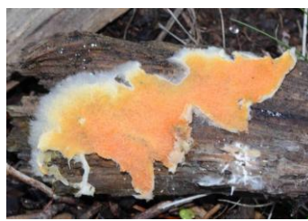
Leucogyrophana mollusca ( Merulius pseudomolluscus )