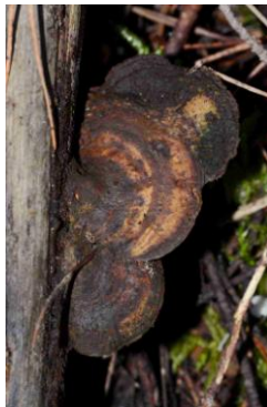
Daedaleopsis confragosa (Tramète rougissante)