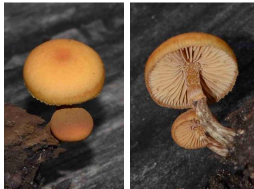
Galerina marginata (Galère marginée)