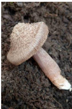
Inocybe cervicolor (Inocybe couleur de cerf)