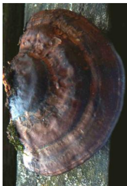
Scenidium nitidum, Daedaleopsis nitida (Polypore nid d'abeilles, Tramète brillante)