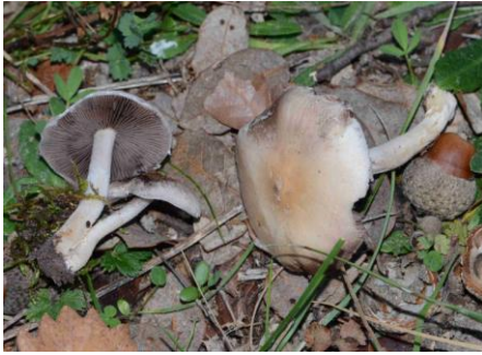
Psathyrella candolleana (Psathyrelle de Candolle)