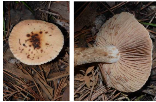
Hebeloma edurum = Hebeloma laterinum (Hébélome cacaoté, Tante à Nanon)