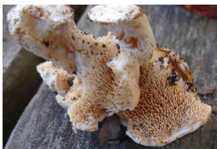
Hydnum albidum (Hydne blanc)