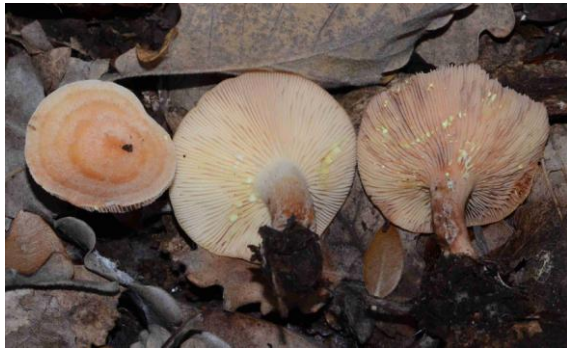
Lactarius chrysorrheus (Lactaire à lait jaune d'or)