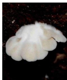
Crepidotus variabilis (Crépidote variable)