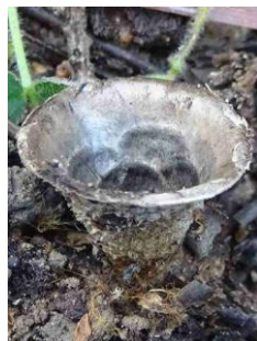
Cyathus stercoreus (Cyathe coprophile)