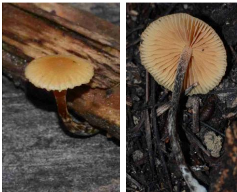
Galerina camerina ?