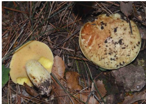
Suillus mediterraneensis (Bolet méditerranéen, Pissacan)