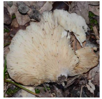
Paxillus panuoides = Tapinella panuoides (Paxille faux panus)