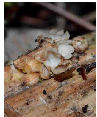
Sphaerobolus stellatus (Sphéroboule en étoile)