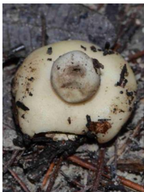
Geastrum fimbriatum (Géastre sessile)