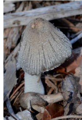
Coprinopsis lagopus (Coprin pied-de-lièvre)