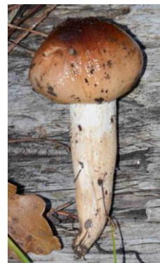
Hygrophorus roseodiscoideus (Hygrophore discoïde rosé)