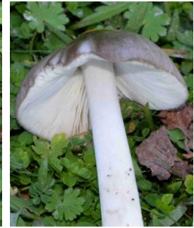
Volvariella gloiocephala (Volvaire visqueuse)