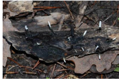
Xylaria hypoxylon (Xylaire du bois)