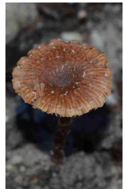
Gymnopus foetidus (Marasme fétide)