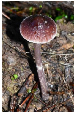
Psathyrella bipellis (Psathyrelle à deux peaux)