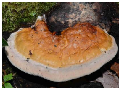
Fomitopsis pinicola (Amadouvier des pins, Polypore marginé)