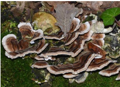
Bjerkandera adusta (Polypore brûlé, Tramète brûlée)