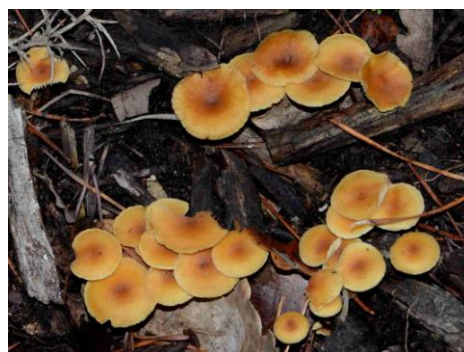
Xeromphalina caudinalis (Omphale amère)