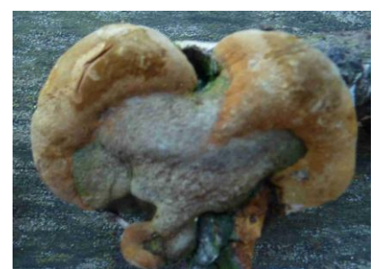
Phellinus robustus (Polypore robuste, Phellin du chêne)