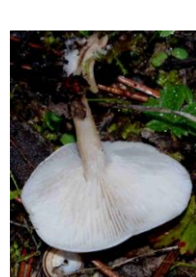
Clitocybe dealbata (Clitocybe blanchi)