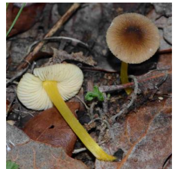
Pluteus romellii (Plutée de Romell)