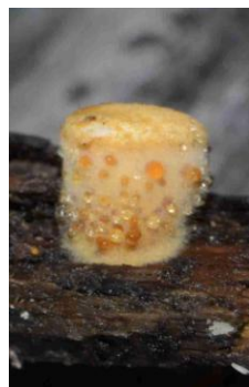
Crucibulum laeve (Crucibule lisse)