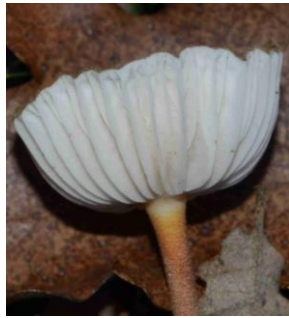
Xerula pudens = Oudemansiella longipes (Collybie à long pied)